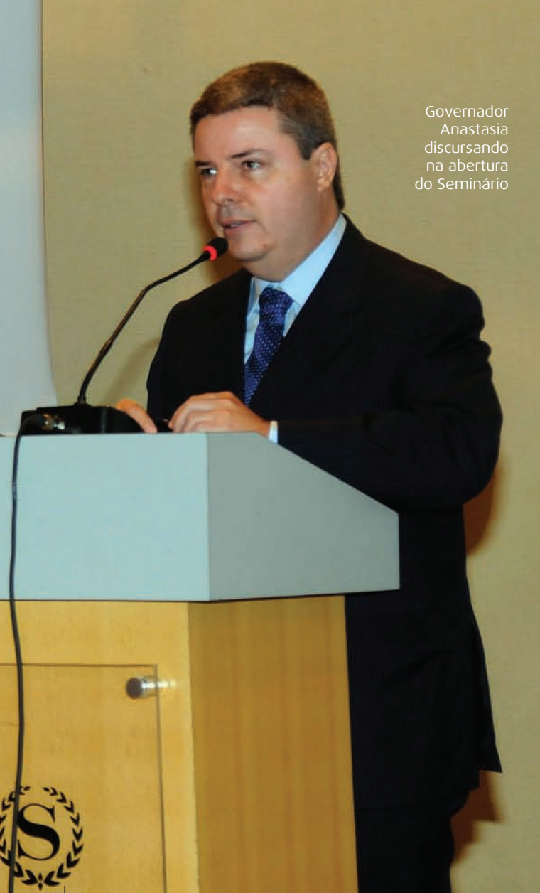
Governador Anastasia discursando na abertura do Seminário